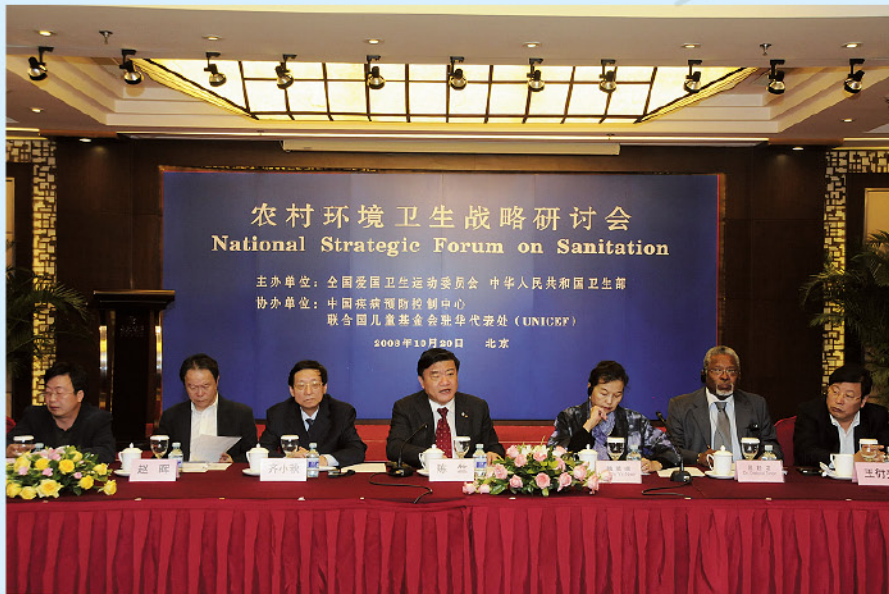
陈竺部长参加农村环境卫生战略研讨会

2008年6月10日：“环境卫生与个人卫生知识倡导项目（KASH）”中期评审会在国家发展与改革委员会国际合作中心召开。发改委社会司、水利部、卫生部、英国国际发展署、联合国儿基会及发改委国际合作中心等项目执行机构的相关人员出席了此次会议。会议主要讨论了中期评估如何进行及目标等内容。中期评估将分两步进行，第一步主要是回顾过去两年中项目的执行情况以及取得的成绩，第二步是评估在接下来的时间内，该项目是否需要做一些调整以适应新的形势，以及今后项目该如何进行。