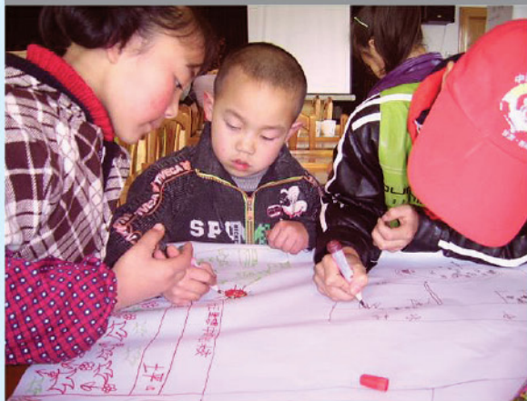
孩子们在描绘理想中的卫生厕所