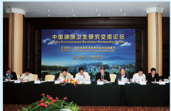
中国环境卫生研究交流论坛现场气氛热烈

2009年10月21日：国家发改委社会司与联合国儿童基金会在北京组织召开了“中国环境卫生研究交流论坛”第一次会议，论坛的建立得到了卫生部、水利部、环保部的大力支持。来自卫生部、教育部、环保部、住房和城乡建设部、国务院发展研究中心和地方政府的代表，世界卫生组织、世界银行、英国国际发展部、中国科学院、卫生部卫生经济研究所、中国疾病预防控制中心、中国环境科学院、北京大学、同济大学的国内外专家，共计40余人参加了论坛第一次会议的交流与研讨。