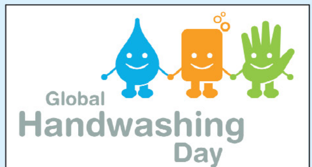
全球洗手日标志：水滴、肥皂和手

从2008年开始发起创建的“全球洗手日”主题宣传活动是一项由公共与私营部门共同发起以推动用肥皂洗手的倡议活动，规定每年的10月15日为“全球洗手日”，其目的旨在提高民众的环境卫生意识，推动正确卫生行为习惯的养成。至今为止，“全球洗手日”主题宣传活动已经在中国成功举办两届，并取得了显著的成效。