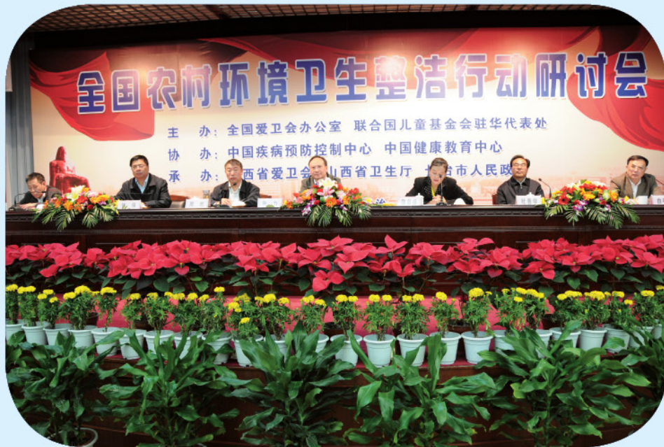
尹力副部长出席全国农村环境卫生整洁行动研讨会

2009年10月10日：由全国爱国卫生运动委员会办公室和联合国儿童基金会联合举办的全国“农村环境卫生整洁行动”研讨会在山西省长治市召开。会议的主要任务是总结前一阶段农村环境卫生试点成果，交流典型地区城乡环境卫生成功经验，研讨“农村环境卫生整洁行动方案”。