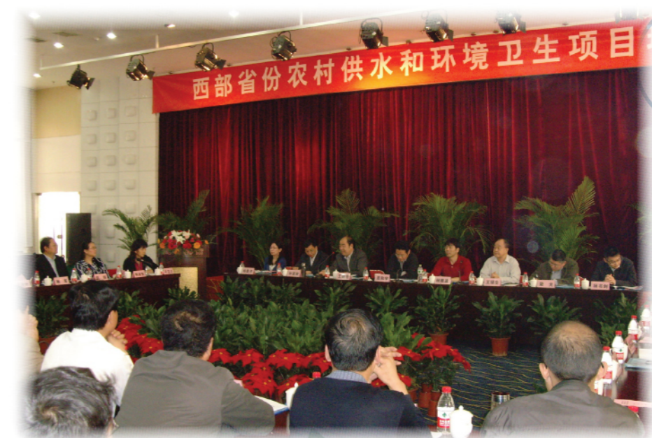
交流会现场气氛热烈

通过本次现场考察交流会，与会代表对陕西农村供水和环境卫生取得的成绩给予了充分肯定。并且认为西部省份农村供水和环境卫生项目存在以下特点：一是该项目定位准确，从2005年开始策划，到签订协议，2008年正式启动，其定位就是积累总结经验，为国家的工作提供参考经验；二是参与范围广，影响面大，外方有世界银行、英国国家发展部（DFID）、联合国儿童基金会（UNICEF），从国内来讲，以发改委牵头，卫生、水利等多部门共同参与推进，在健康教育领域中又积极引入妇联参加，扩大了项目影响力；三是陕西的工作得到了各级部门的高度重视，各级政府都动员起来，省里由省长亲自挂帅，县里由县委书记县长具体领导协调，把民生工程当成政府主要任务来抓，因而项目进展顺利；四是各级实施单位工作细致扎实，有项目管理办法、实施细则、工程验收办法，财务管理的一系列的办法，健康教育也有专门的实施方案等。