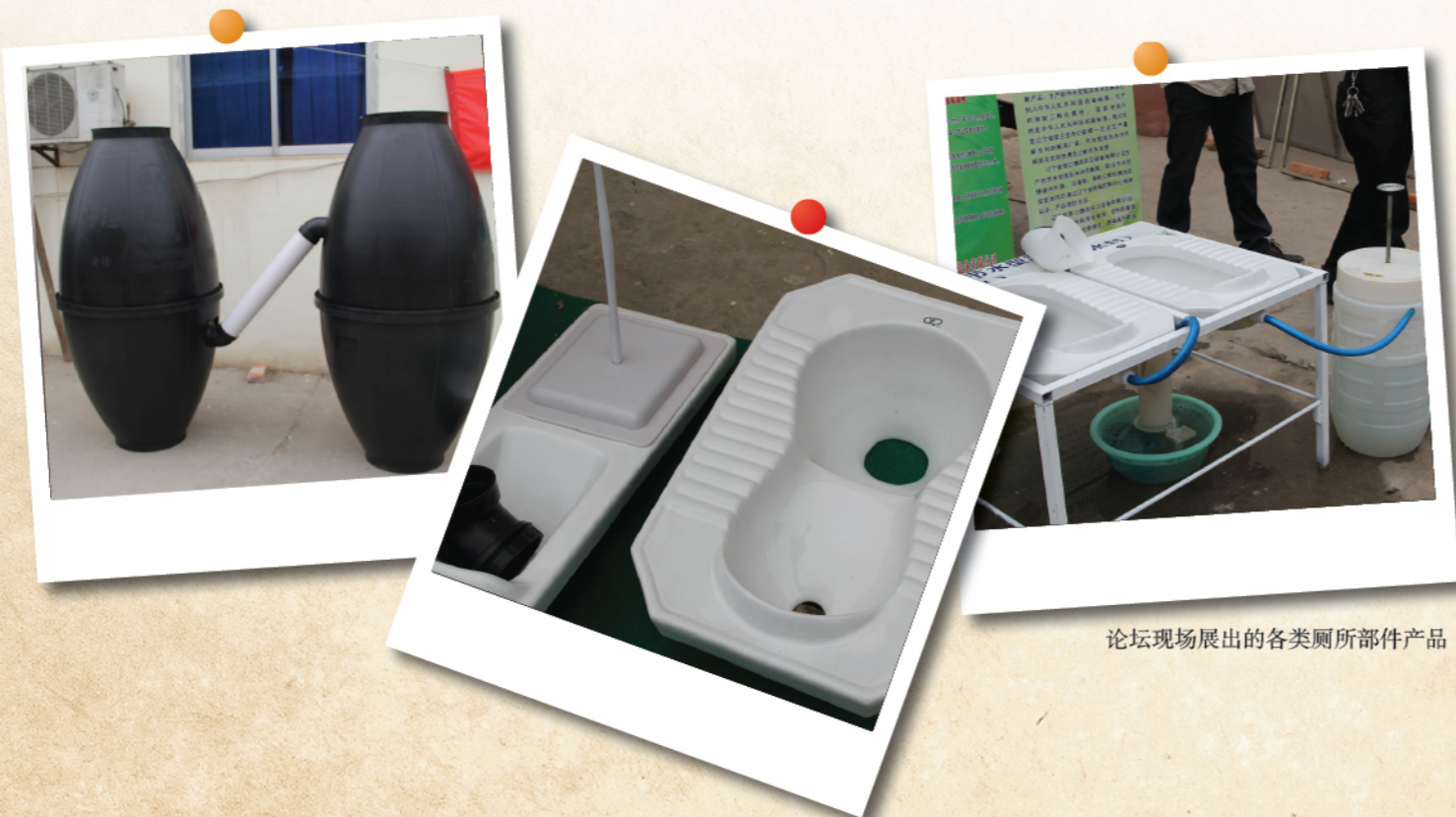
论坛现场展出的各类厕所部件产品

此次论坛共收录了43篇文章编辑了《全国农村环境卫生市场机制论坛论文集》，从收集的文章来看，目前农村环境卫生市场机制多为工作性和实践工作的经验积累，希望以后多开展学术研究方面工作，为建立农村环境卫生市场机制提供科学依据。