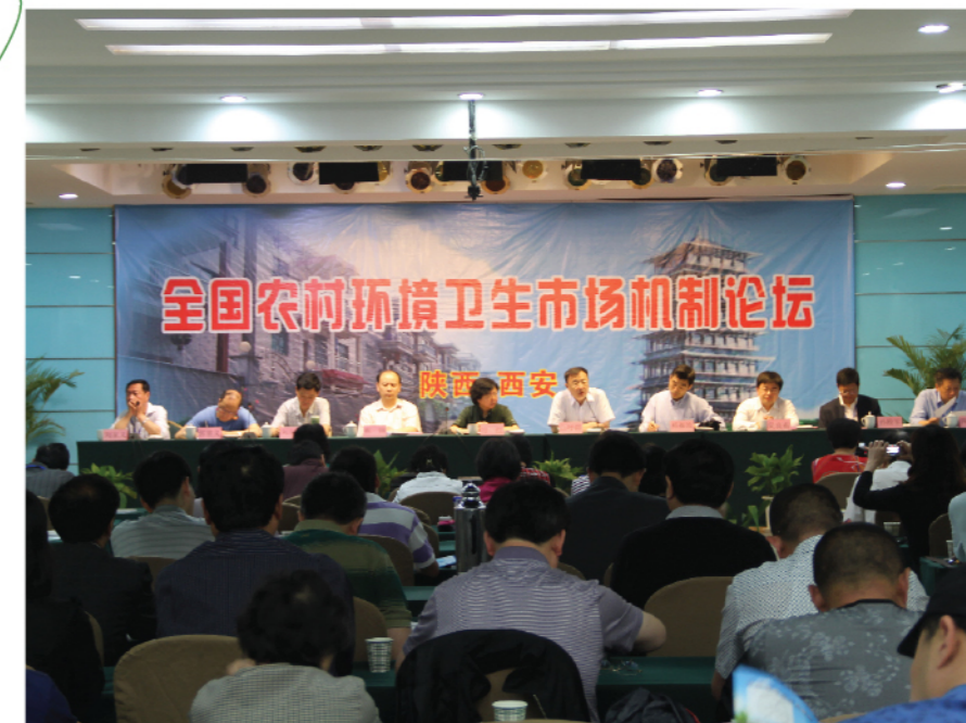
全国农村环境卫生市场机制论坛现场

2011年5月9-10日，全国农村环境卫生市场机制论坛在陕西省西安市召开。本次论坛旨在分析总结我国农村环境卫生市场化现状、机遇和挑战，探讨中国农村环境卫生市场机制。各省市爱卫办、疾病预防控制中心、改水改厕专业委员会委员、论文集作者、卫生厕所生产企业等约130人参加了此次论坛。全国爱卫办白呼群副局长和陕西省卫生厅习红副厅长到会并做重要讲话。