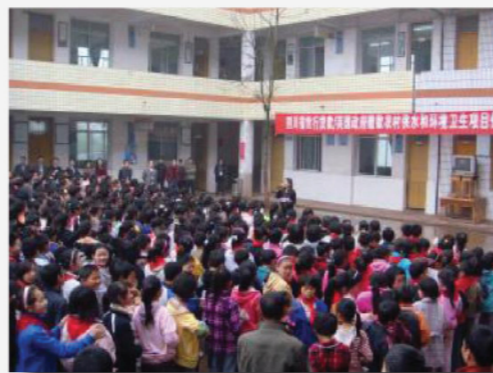
四川广安区小学开展健康教育宣传活动

活动。四川省健康教育的开展围绕“用皂洗手”和“安全处理粪便”两个核心内容，分别在每个项目县(区)的项目所在地的村小(或者中心小学)和农村社区针对不同目标人群开展不同形式的活动。活动当天，广安区项目办在龙安小学开展了健康教育宣传活动，通过知识讲座、播放片子、有奖竞答、学唱洗手歌、情景剧表演、肥皂救援游戏、用皂洗手宣誓、游行等丰富多彩的活动，把“用皂洗手”这一核心信息通过寓教于乐的形式传递给学生们以及他们的家长。活动现场，领导和专家认真观看了专题片，并和同学们一起承诺用皂洗手。在农村社区，组织了村民看专题片和开展了知识讲座以及有奖知识竞答、入户与孕妇或新生儿母亲的访谈等活动，向村民传递了用皂洗手和安全处理粪便的主题内容。