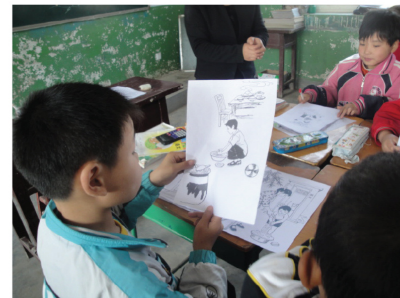
儿童全神贯注地看图学习卫生知识

2、妇女儿童的健康需求是做好项目工作的基础。项目活动的开展之所以受到人民群众的欢迎，其重要原因是广大妇女儿童非常需要社会的