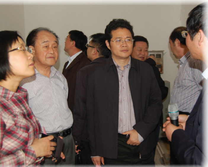
会议代表赴南可村开展现场考察

与会代表提出以下建议：一是当前正在制定“十二五规划”，衷心期待项目能深入总结经验，挖掘好的典型，总结成功模式，为国内的项目实施工作提供参考和借鉴；二是本项目起点高，邀请了众多国际专家参与，为后续工作的开展奠定了很好的工作基础，建议开展比较研究，如开展健康教育的村庄卫生习惯改变情况和没有开展的村庄有什么差距，并进行一些实证研究，为后面的工作提供基础资料；三是建议相关厅局能够充分发挥行业的技术力量，加强行业管理、加强管理人员的能力建设，帮助各项目点开展工作。